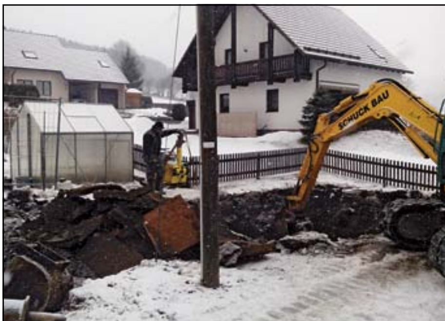
Die Arbeiten im Bereich der Ortslage Schönfeld werden ebenfalls im Jahr 2013 weitergeführt. Die Realisierung dieses Bauvorhabens wird durch Mittel des Ziel 3-Programms der Europäischen Union gefördert. Im obigen Bild ist der Abbruch der Kläranlage in der Oberen Bergstraße zu sehen.

Im nichtöffentlichen Teil wurden keine Beschlüsse gefasst.