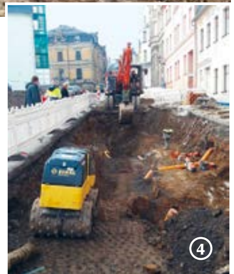
1 – Walthersdorf, 2 – Industriegebiet B101, 3 – Scheibner Straße, 4 – Klosterstraße