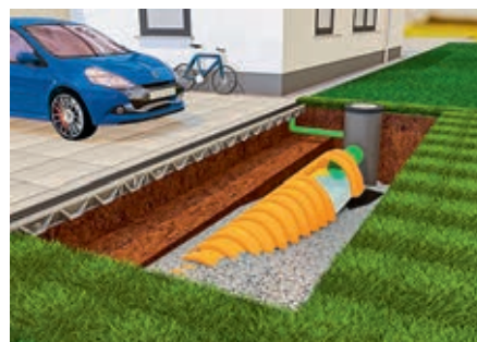
Beispiel für eine Versickerungsregole von Regenwasser