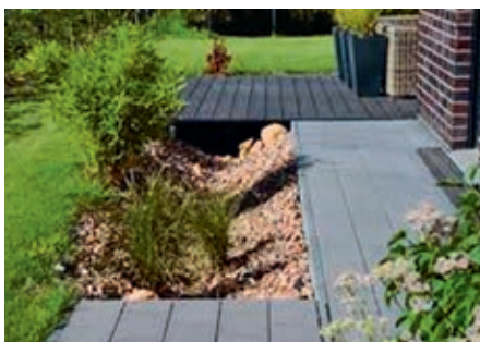
Beispiel für einen Versickerungsgraben von Regenwasser

Der Abwasserzweckverband steht Ihnen hierzu gern beratend zur Verfügung.