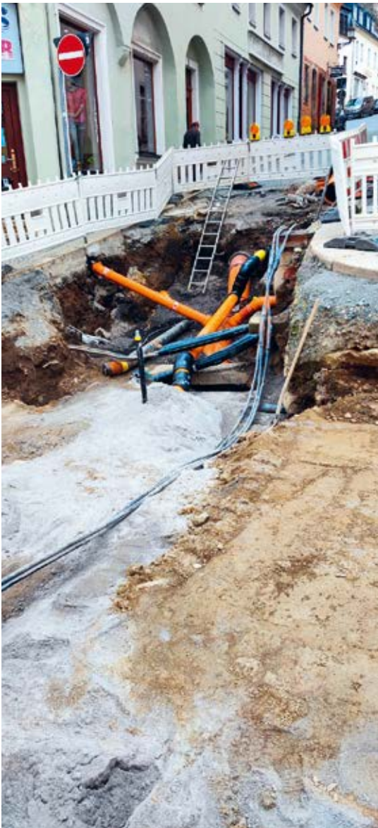
Annaberg-Buchholz, Mircotunneling Bereich Erzgebirgsklinikum ↓