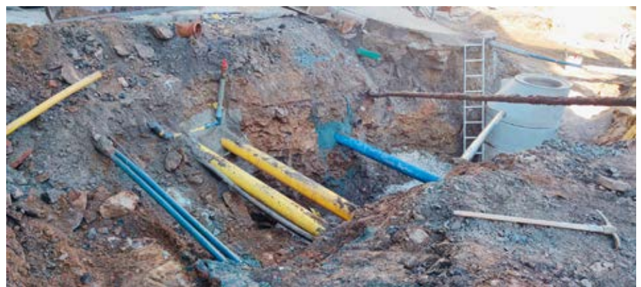
Annaberg-Buchholz, Erbgerichtstraße ↓