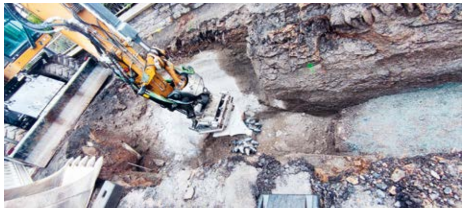
← Walthersdorf, Alte Scheibenberger Straße