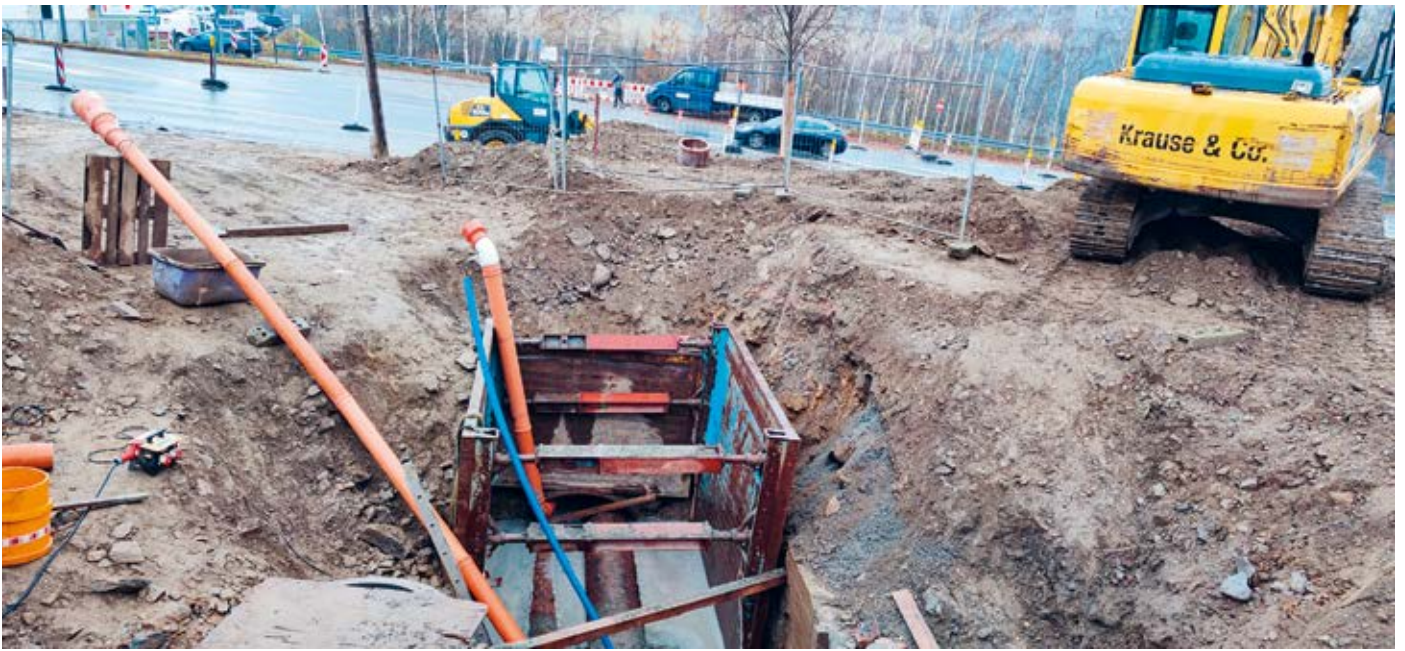
Annaberg-Buchholz, Bereich Erzgebirgsklinikum ↑